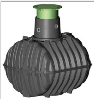
Depósito Carat con cubierta paso peatones