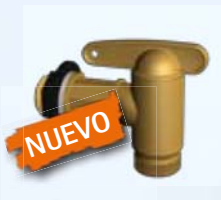
Grifo de PE Uni-versal Aqua-Quick de 3/4" Código 504040