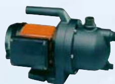
Bomba Garden Jet 700 Bomba autoaspirante Potencia de 0,7 KW, altura máx. 40 m, presión máx. 4,0 bar, caudal máx. 3000 l/h, altura máx. de aspiración 8 m, largada máx. de aspiración 15 m. Código 354012