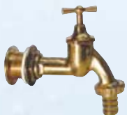
Grifo de latón para Top-tank de 3/4" Código 330138